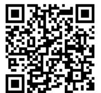
WIRED TOKYO 1999 WEB

* 見学可能人数に限りがあるため、応募者多数の場合は先着順とさせていただきます。